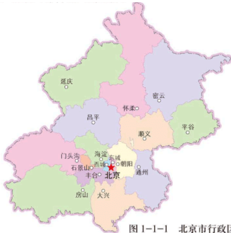
图 1-1-1 北京市行政区划 1:2 000 000