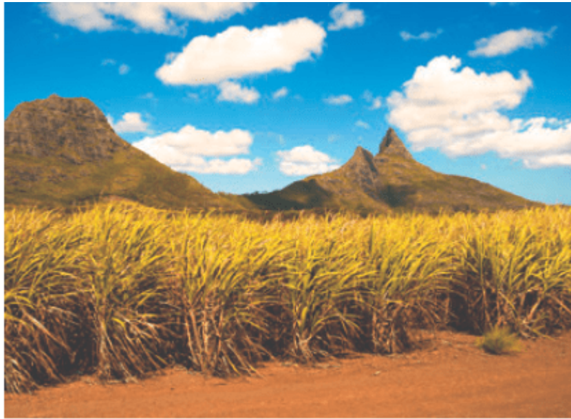
图 1.19 毛里求斯种植的甘蔗

自1968年独立以来，毛里求斯经济长期保持稳定发展。毛里求斯有“糖岛”之称（图 1.19），制糖业曾经是毛里求斯的经济基础，其产值一度占国内生产总值的1/3，出口额占出口总额的99%。随着经济的发展，以及受国际形势影响，毛里求斯传统的制糖业、纺织服装加工业不断萎缩，旅游业、金融业、信息通信业稳定增长。目前，毛里求斯积极培育海洋产业、高端制造业、现代服务业等新兴支柱产业，力求把毛里求斯岛打造为区域航空中心、海运枢纽和金融服务中心。