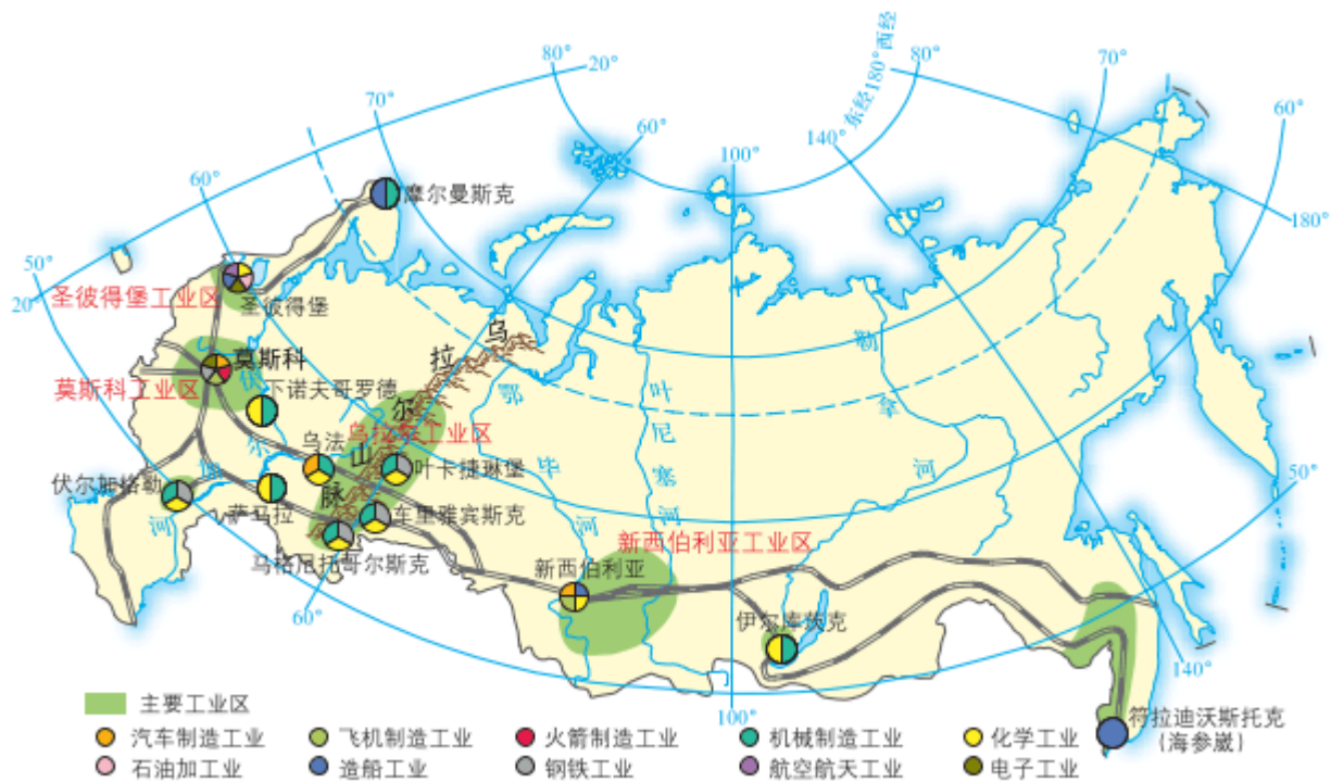
图 1-31 俄罗斯工业空间分布

为了缩小区域发展差异，2007年俄罗斯出台了《俄罗斯联邦经济社会发展长期战略构想》，通过交通运输的联网，发展电力等基础设施，在国土北部、东部和南部开发能源项目，改变传统能源基地的单一结构，规范劳务移民，促进东西伯利亚和远东经济的平衡与多样化发展，完善区域发展政策，培育地区增长极等，实现东西两大地带的协同发展。