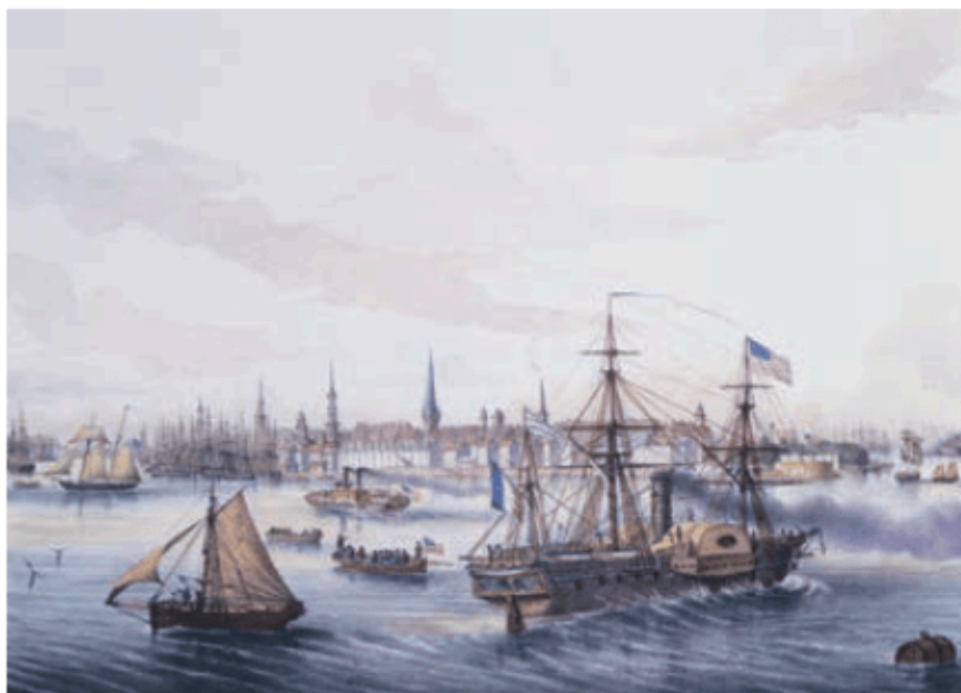
图 3.5 历史时期的纽约港

纽约位于美国大西洋沿岸中部的哈得孙河河口，港口条件得天独厚（图3.5）。1825年，伊利运河开通（图3.6），大量的商品通过伊利运河很便捷地运往纽约港，纽约的腹地迅速扩展到中西部地区，并开始加速发展，成为美国最大的贸易口岸。之后，经过一百多年的发展，20世纪30年代，纽约成为世界上第一座人口超过1000万的城市（图3.7）。