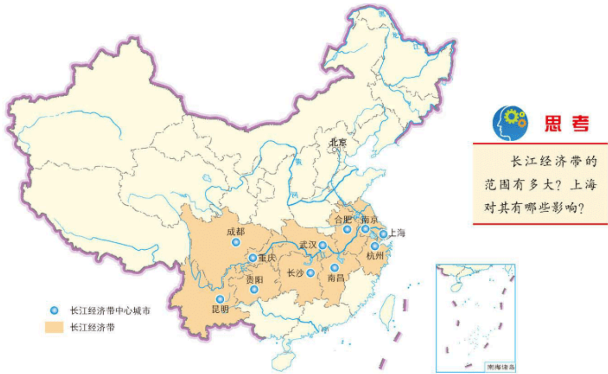
图 2-1-8 长江经济带 1 : 40 000 000