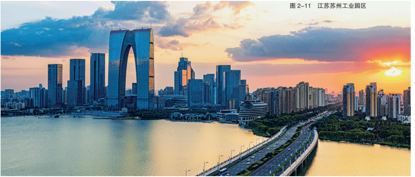
图 2-11 江苏苏州工业园区