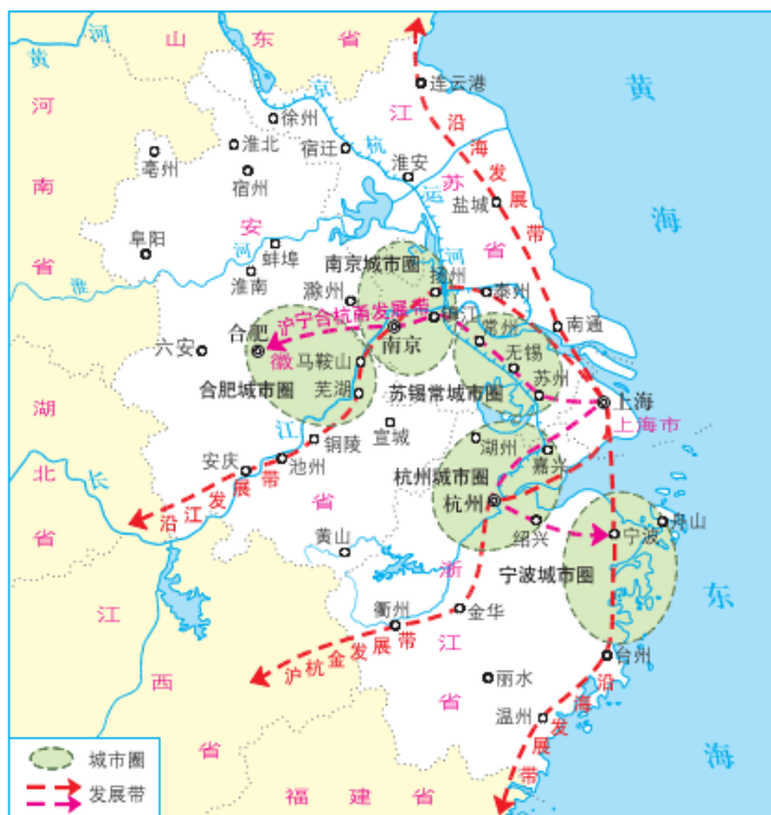
图 2-10 上海与长江三角洲协作发展示意

通过现代化的交通运输网络，上海拉动了南京都市圈、杭州都市圈、合肥都市圈、苏锡常都市圈、宁波都市圈的发展壮大，强化了沿海发展带、沿江发展带、沪宁合杭甬发展带、沪杭金发展带的聚合发展，进而形成了“一核五圈四带”的网络化空间格局。