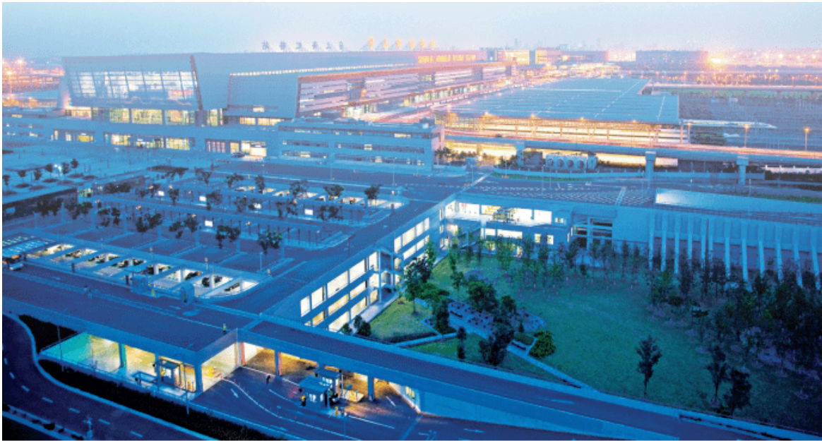
图 2-6 上海虹桥枢纽中心

上海虹桥综合交通枢纽占地 26 平方千米，距离市中心 12 千米。该枢纽具有高速铁路、城际铁路、高速公路客运、城市轨道交通、民用航空等枢纽换乘功能，集散客流量平均为 48 万人次/日，能够吸引大量商务和旅游客流，形成都市交通枢纽。