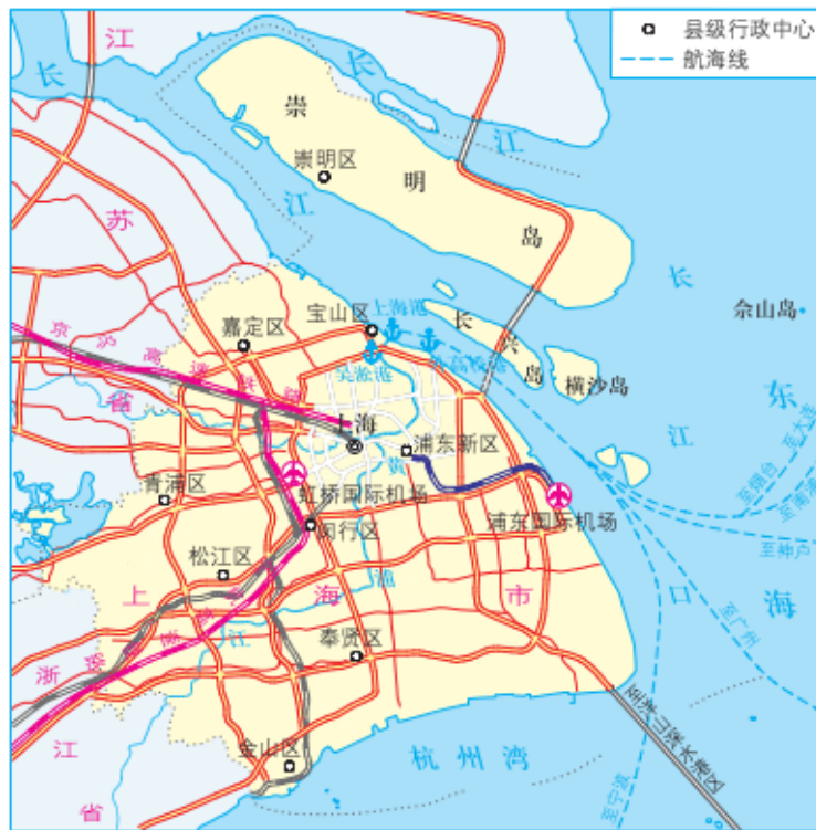
图 2-5 上海交通网络分布

交通运输枢纽功能：上海作为长江流域门户，拥有高效率的综合交通运输网络，中心城区已建成立体交通网络。上海拥有虹桥、浦东两大国际机场，上海港是我国主要的外贸港之一，拥有外高桥、吴淞、洋山等深水港区。