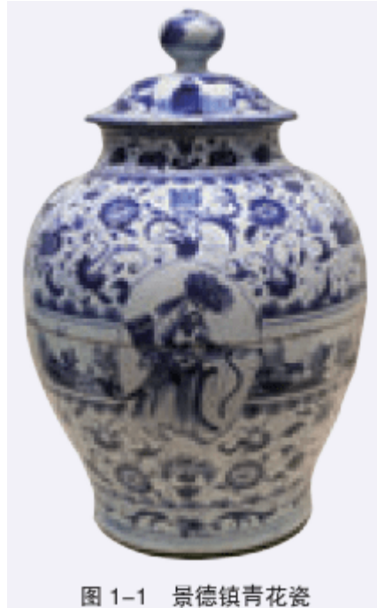
图 1-1 景德镇青花瓷

生产瓷器用的瓷土，又称“高岭土”，因发现于我国江西景德镇市浮梁县高岭村而得名。景德镇境内瓷土矿资源分布广泛。依托优质的瓷土矿资源，千百年来能工巧匠造就了享誉世界的“瓷都”。