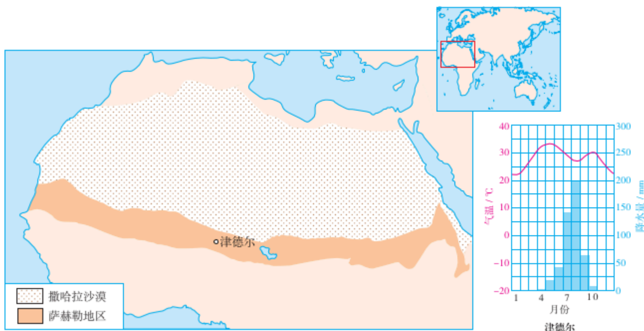
图 2.14 萨赫勒地区示意

荒漠化是土地退化的一种表现形式。20世纪60年代末至70年代初，萨赫勒地区遭受罕见大旱，并引发了严重的荒漠化，致使经济受到沉重打击，前后有20多万人因饥饿而死亡，千百万人流离失所。这场惨剧引发了国际社会的普遍关注，从而在全球范围内引发了一场轰轰烈烈的世界荒漠化防治运动。萨赫勒地区通常是指撒哈拉沙漠南缘东西延伸的干旱与半干旱、热带沙漠与热带草原的过渡地带，年降水量大多为100—500毫米。