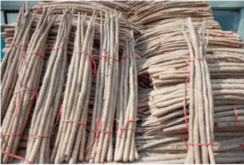
图 2.30 焦作市铁棍山药

铁棍山药属怀山药的改良品种，因其外形酷似生锈的铁棍，故名。由于特殊的土质、水和气候条件，焦作市是铁棍山药的主产地，为中国地理标志保护产品。