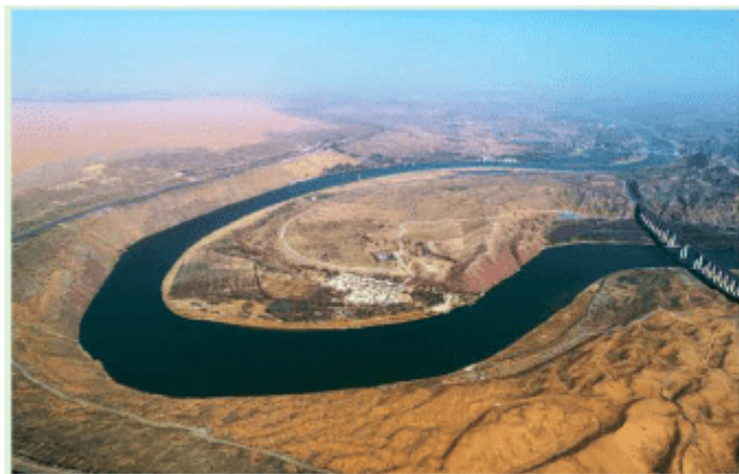
图 3-3-1 2021 年 3 月 3 日黄河流经宁夏中卫市沙坡头区