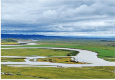
图 3-3-4 黄河上游

三角洲湿地生物多样。黄河流域自然景观壮丽秀美，沙漠浩瀚，草原广布，峡谷险峻，壶口瀑布更是气势恢宏。