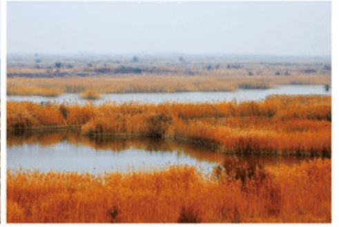
图 3-3-6 黄河三角洲湿地

黄河流域是我国重要的经济地带。华北平原、汾渭平原、河套灌区是农产品主产区，粮食和肉类产量约占全国的1/3。黄河流域煤炭、石油、天然气和有色金属资源丰富，煤炭储量占全国一半以上，是我国重要的能源、化工、原材料和基础工业基地。