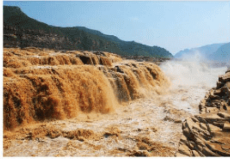
图 3-3-5 黄河壶口瀑布