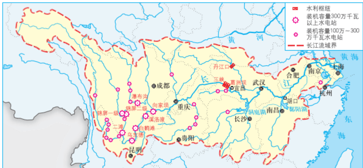
图 3-25 长江流域水电站分布

长江干支流水能资源极为丰富，可开发量为1.9亿千瓦，占全国可开发量的一半以上。长江宜昌以上的河段水能资源占全流域的80%以上，且主要集中在金沙江段和长江三峡段。合理开发长江水能资源，国家进行了科学论证和周密部署，相继修建了长江三峡水利枢纽、溪洛渡水利枢纽等一系列水利工程。