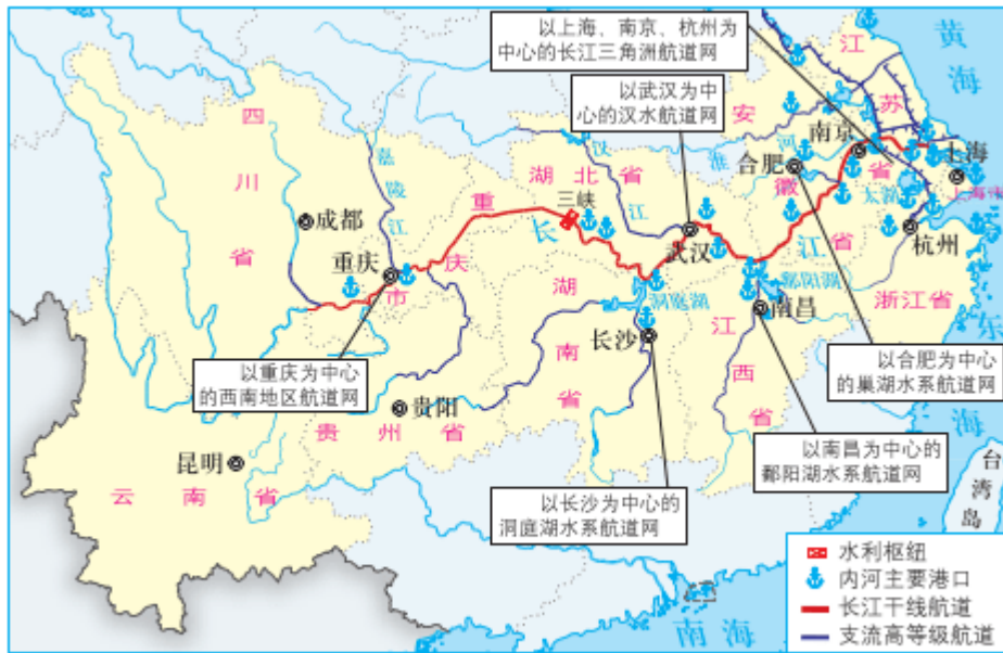
图 3-24 长江黄金水道示意