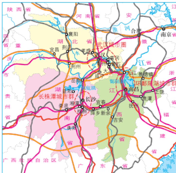
图 3-23 长江中游城市群

长江中游城市群要加快武汉—九江、长沙—南昌等城际铁路建设，形成环状快速铁路交通网，构建2小时经济圈。