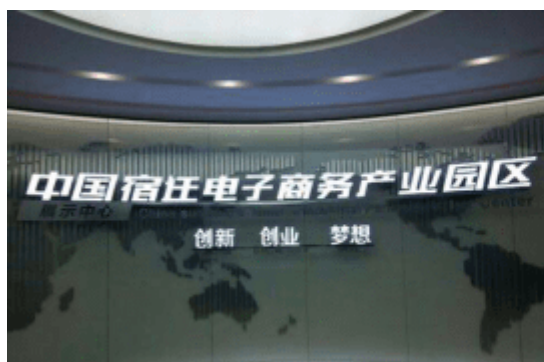
图4-4-3 宿迁市电子商务产业园区