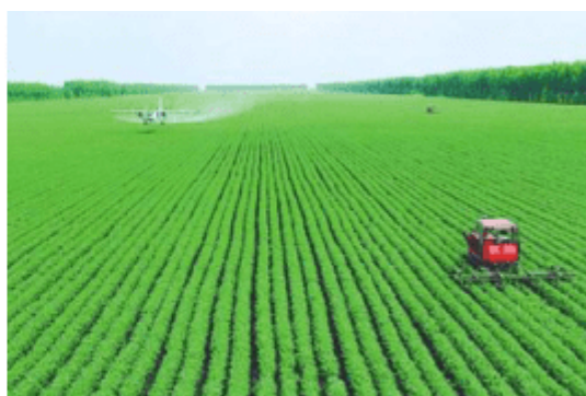
图4-4-4 淮安市现代农业