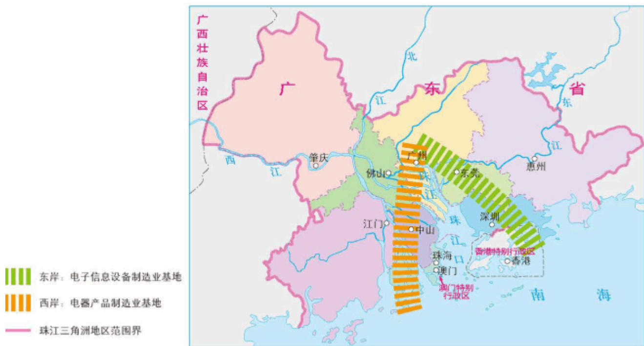
图 3-1-10 珠江三角洲地区产业总体布局 1:4 500 000

促进产业分工与合作： 珠江三角洲地区通过产业转移，实现了资本、信息、技术等生产要素与承接地劳动力和自然资源等生产要素的优势互补，促进了珠江三角洲地区与产业承接地之间的产业分工与合作。产业承接地通过承接优势产业，提升核心竞争力，形成区域间合理的产业分工，避免产业同质竞争。