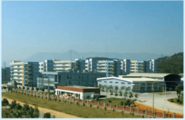
图 3-1-7 清远市工业园