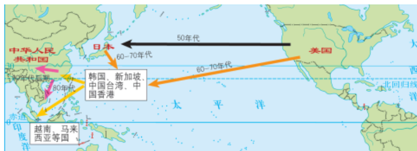
图3-2-2 亚太地区劳动密集型产业转移主要方向

20世纪90年代后期开始，美国、日本不断输出资本与技术密集型产业，韩国、新加坡及我国香港、台湾等地的劳动密集型产业则不断向东南亚其他国家和我国中西部地区转移。